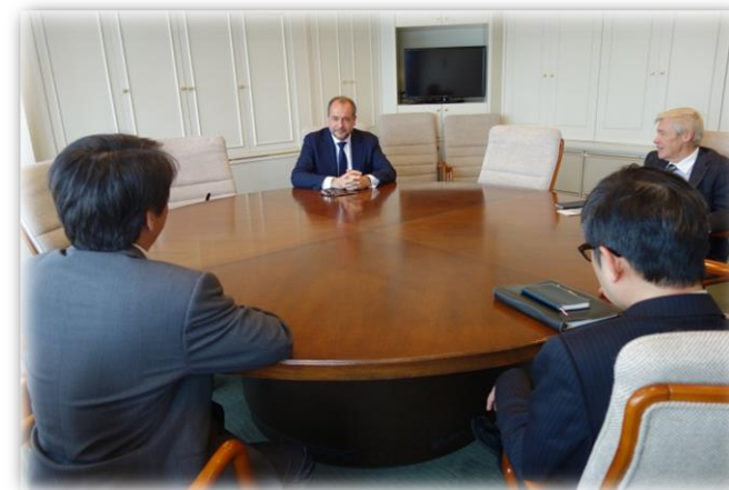
当事務所会議室にて