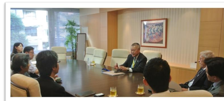
当事務所会議室にて